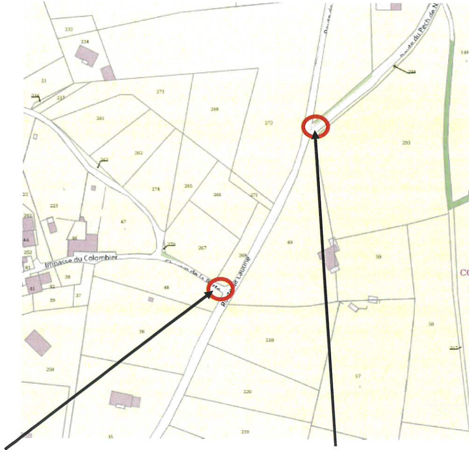
Stop sur la VC 504 (Chemin de la Barthe)