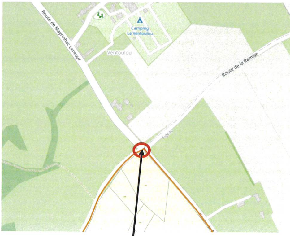
Stop sur la VC 103 (Route du Bois Noir)

Fait à Laveugne, le 14/10/2025 Le Maire Didier BES